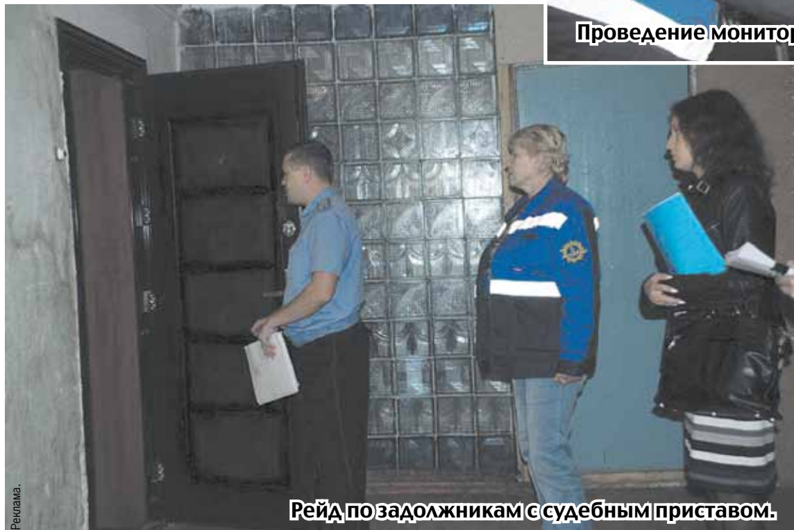
Рейд по задолжникам с судебным приставом.